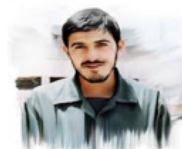
مهره انبیه احمدی روحانی خرمشهر