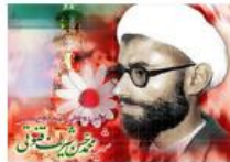
مهره انبیه احمدی روحانی خرمشهر